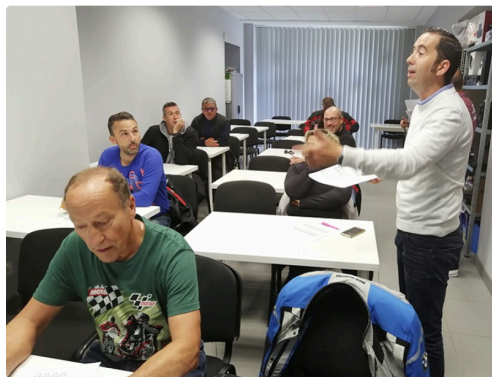
Piqûre de rappel avec la séance code de la route