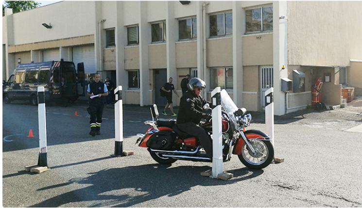
Pour mieux vivre la route

Ce dimanche se déroulait, dans l'enceinte de la gendarmerie mobile de Mirande et sur les routes gersoises, le challenge Jean-Pierre Louchart.