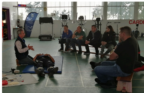
Les gestes qui sauvent