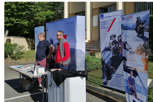
Un bureau d'information