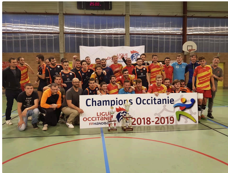
HBCL : C'est fait !

En demi-finale Excellence Occitanie, la première équipe qualifiée est donc le HBCL Handball Club de l'Isle-Jourdain qui l'a emporté 32 à 24 face à Narbonne.