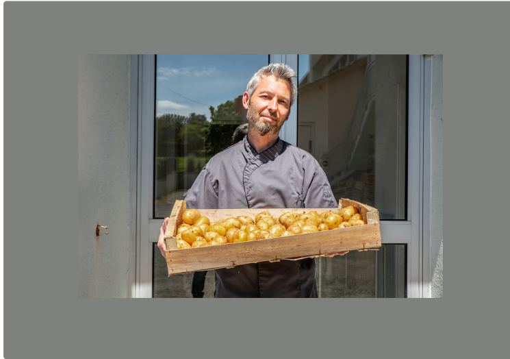
Conférence passionnante pour les « mangeurs » à l'Écofête de Perchède