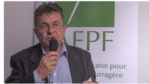
Michel Duru - Photo petitjournal.net