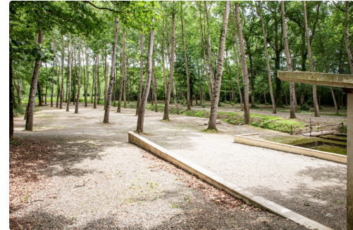
Emplacement de la future Ecofête