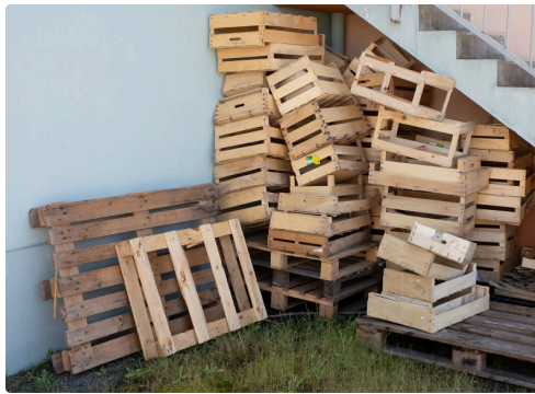
Tas de cageots de fruits et légumes dans la cour de la cantine : preuve de l'utilisation de légumes et fruits frais