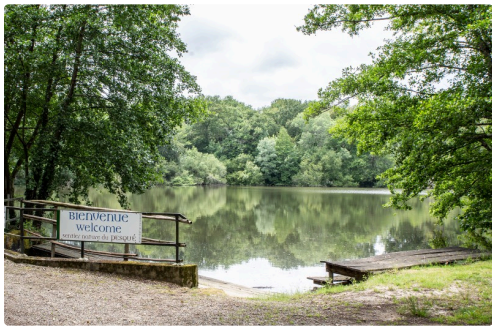
Abords de l'étang du Pesquè