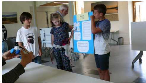
Présentation du projet au jury.

Prix coup de cœur du jury : V.O.L 23, Ordan-Larroque ; prix endurance : Fast'Auch 2, Jean Jaurès ; prix de la vitesse : V.O.L 23, Ordan-Larroque.