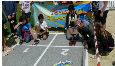
Prêts pou le départ.