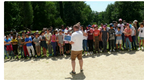
Les enfants attendent impatiemment les résultats.