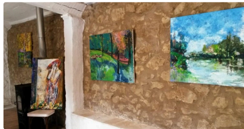
L'atelier est ouvert tous les matins