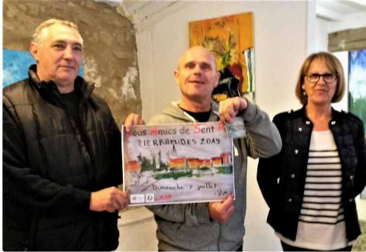
En attendant les Pierramides

Entre deux réunions de préparation des prochaines « Pierramides » qui auront lieu le dimanche 7 juillet, des membres de l'association « Lous Amics de Sent Pé » sont allés à la découverte de l'exposition de Pim Harren, ce mardi 11 juin.