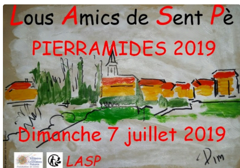
Le logo, création de Pim