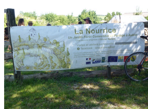
Toutes les étapes de la construction de La Nourrice sont exposées à gauche de cette entrée.