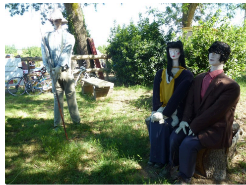
Ils vous accueillent à l'entrée du jardin

[3] Ce moment de répit, cette création sonore était diffusée à la même heure, en direct, sur les ondes de Radio Côteaux, radio à retrouver sur 104.5 ou 97.7. Radio Côteaux est une radio associative créée en 1983 et installée à Saint-Blancard depuis 1999. En priorité, elle a un rôle de promotion de la vie locale pour créer du lien social.