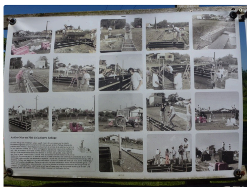
Construction du mur en pisé de la serre-refuge