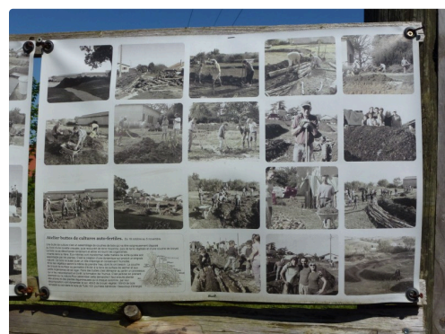
Les buttes de culture auto-fertiles : trois semaines de travail intense