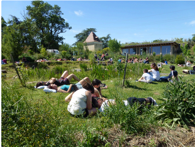
Une sieste bénéfique dans le cadre des rendez-vous aux Jardins

Après-midi relaxation et découverte botanique au jardin de La nourrice