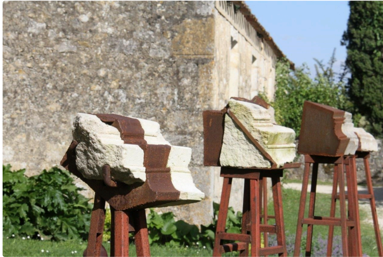
Patrimoine et art contemporain