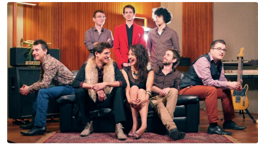
Sugar Bones