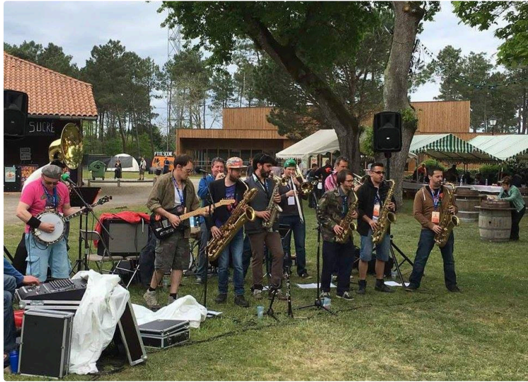
Le Cri'art révèle son programme pour la Fête de la Musique 2019

Vendredi 21 juin à partir de 19 h, la Fête de la Musique se déroule au jardin Ortholan, en cas de pluie, repli au Cri'Art