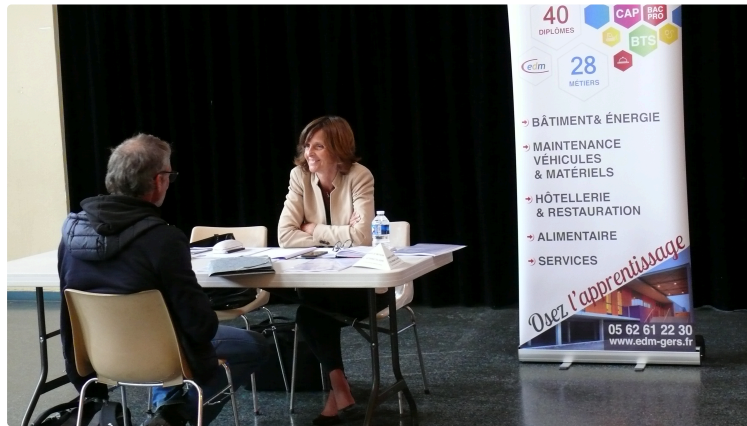
Les demandeurs d'emplois plutôt frileux sur la communauté des communes des Coteaux Arrats Gimone

Le Job dating proposé par 3CAG a connu un succès relatif mais des "pistes d'emplois sont en cours"