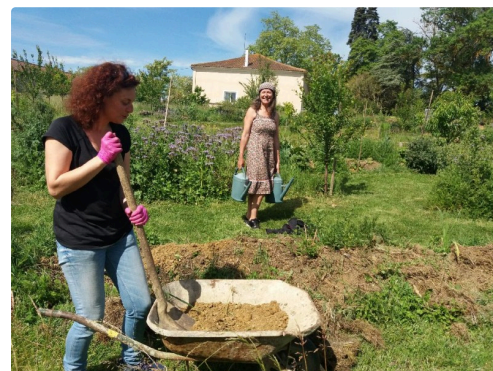
Les bénévoles ne comptent pas les heures et s'activent régulièrement au jardin.