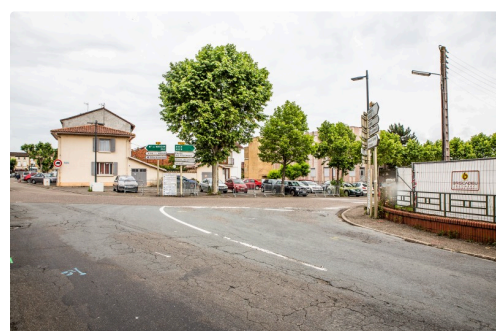
Vue du carrefour de l'avenue des Pyrénées