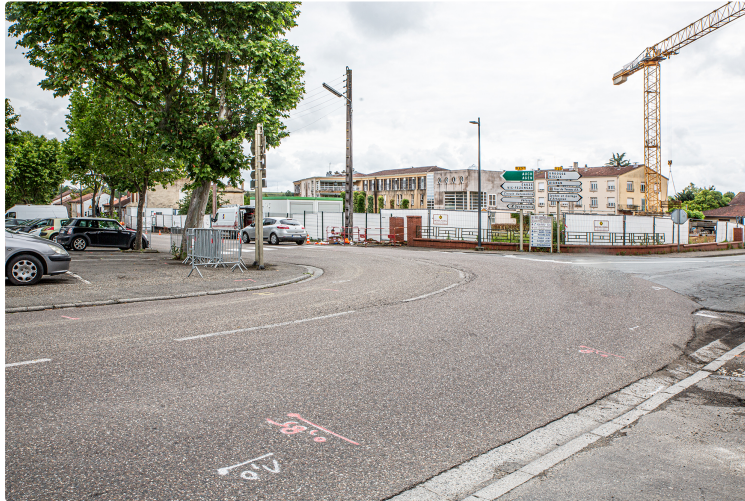
Trois mois de travaux pour le giratoire de l'hôpital