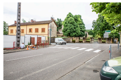
Vue du carrefour des allées Parisot