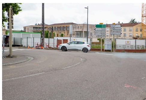
Vue du carrefour de la place des Capucins