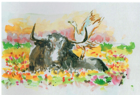
Toro au campo dans un champ de fleurs