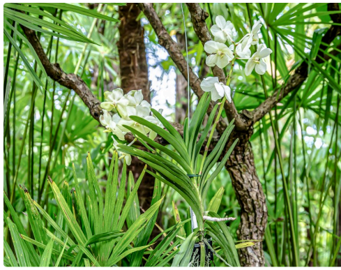
Autre orchidée vanda