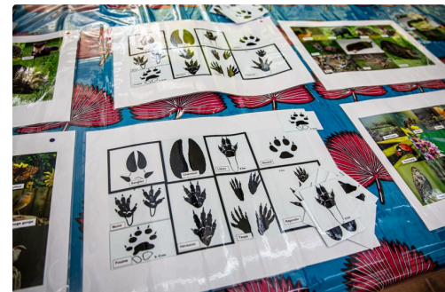
Photos des empreintes d'animaux