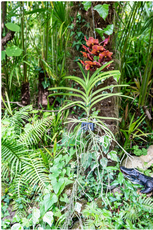
Orchidée vanda à la Palmeraie