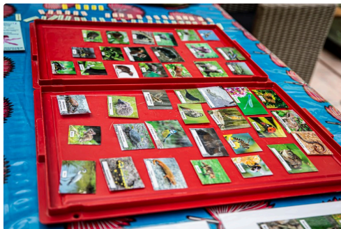
Photos aimantées des animaux pour le jeu