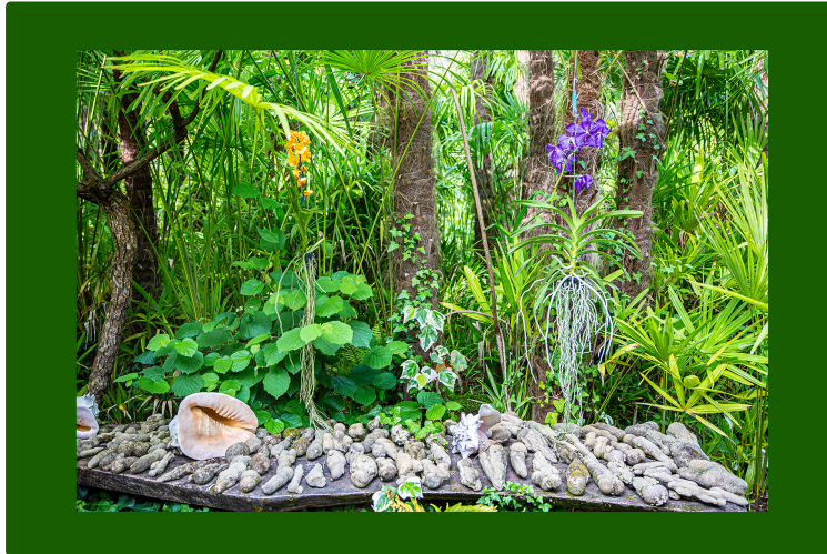
À Bétous, la Palmeraie comme écrin des orchidées

Pour les Rendez-vous aux jardins du prochain week-end