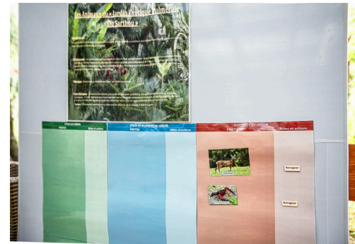
Quiz pour la reconnaissance et le classement des animaux sauvages du jardin