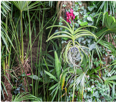
Autre orchidée vanda