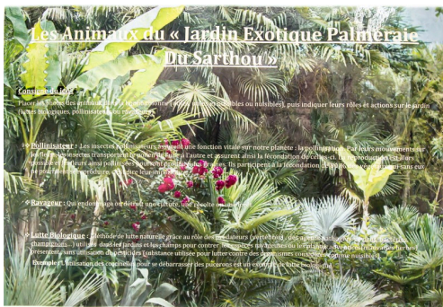
Consigne du jeu