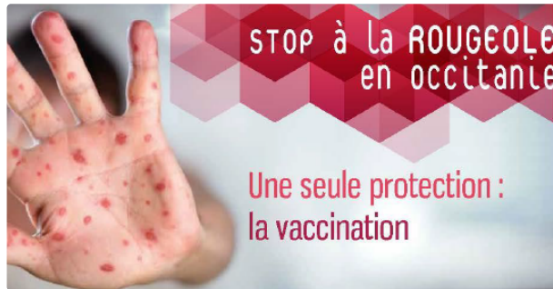
La rougeole continue à progresser en Occitanie

Depuis plusieurs mois, le nombre de cas de rougeole augmente en Occitanie, ce qui témoigne d'une circulation active du virus. Face à cette situation, l'Agence régionale de santé rappelle que le meilleur moyen de se protéger contre la rougeole, c'est de se faire vacciner !