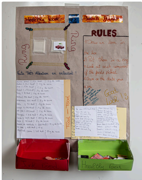
Recette en anglais