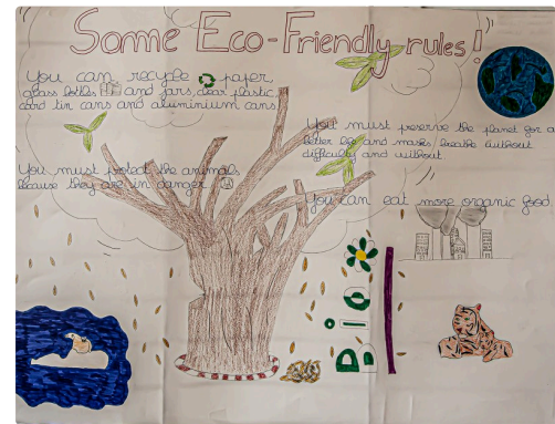
Hymne à l'écologie en anglais