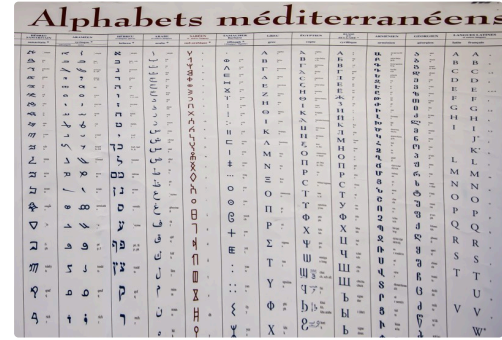
Extrait du tableau "Alphabets méditerranéens" de l'association Alphabets (Nice)