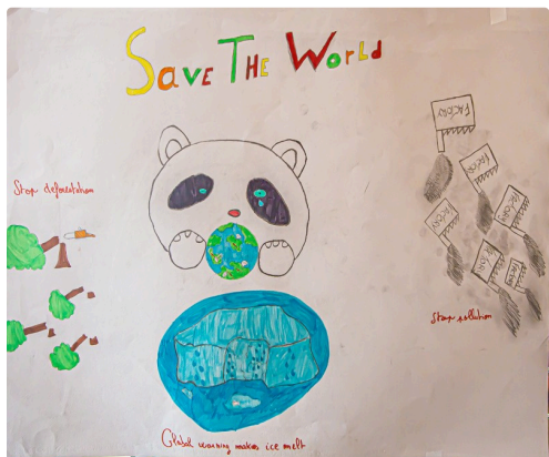
"Save the world"