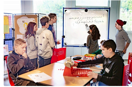
Le même atelier avec présentation de la calligraphie arabe