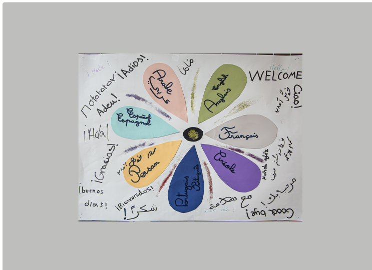
Approvoiser les langues étrangères à la Cité scolaire

Grâce à une semaine de découvertes concrètes