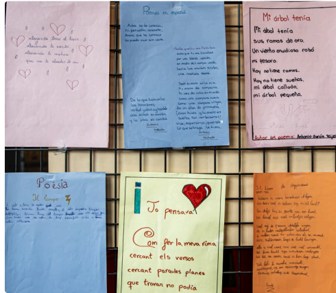
Poèmes en espagnol