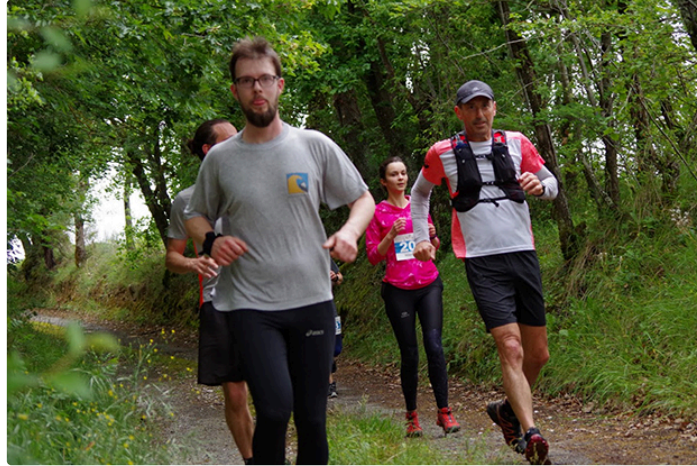
La belle D'Foulée

Dimanche 19 mai dernier, la troisième édition de la D'foulée pessanaise rassemblait 143 coureurs répartis sur le 9,4 ou le 14 km mi route mi chemin à Pessan, tout près d'Auch, ainsi que de nombreux enfants et marcheurs.