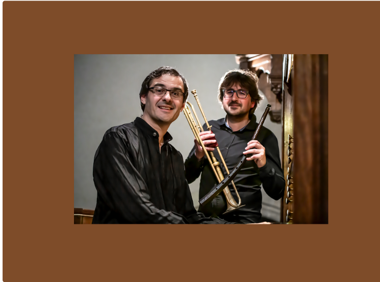
Concert d'orgue, cornet à bouquin et/ou trompette naturelle au Houga