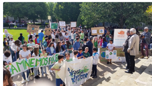
Mirande collegien bis 20190523_103704.jpg

Cette action sera la première d'une série qui va permettre au collège de s'engager dans une démarche éco-responsable en concertation avec les élèves, les adultes ...et ainsi pouvoir prétendre dès l'année prochaine à un référencement Cittaslow.