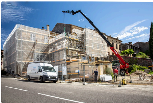
Le chantier vu du coin de la route d'Aire-sur-l'Adour