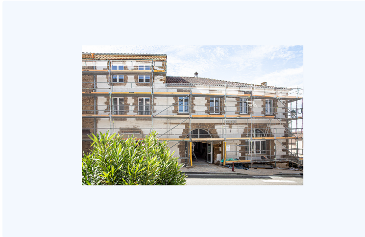
Des travaux qui font du Houga une belle entrée dans le Gers

Certains sont terminés, d'autres en cours ou en projet