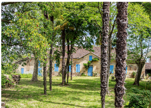
L'Oustalet, future médiathèque