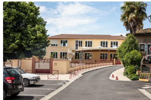
Les abords de l'école