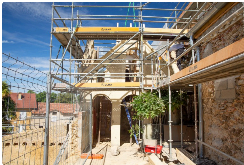
Le pigeonnier sur la terrasse opposée à la RD6 (rue principale)