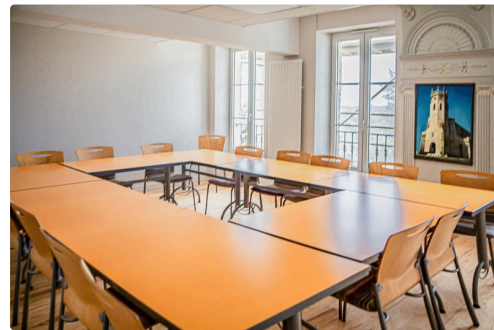
Salle de réunion provisoire