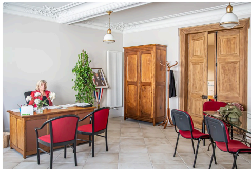
Bureau de la maire en cours d'installation