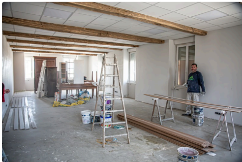
Une salle en plein aménagement