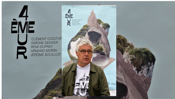
memento saison 4 : 4ème mur

" MEMENTO est un lieu singulier où se conjuguent les traces du passé et la création contemporaine. Cet ancien carmel, devenu archives départementales, se mue au fil des ans pour offrir aux visiteurs une expérience unique de découverte d'œuvres d'art au cœur d'une bâtisse hors du temps. Depuis trois ans maintenant cet écrin patrimonial devient, durant l'été, un terrain d'imagination et de création pour les artistes de la scène actuelle. Tout est parti d'une volonté de vivre l'exposition comme une aventure intime entre le lieu, les artistes et le public. Ce que nous voulons avant tout c'est défendre un endroit où les émotions des pratiques artistiques résonnent."