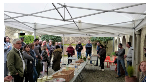
Déjeuner en commun artistes et personnel.