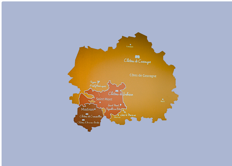
Plaimont s'engage résolument dans l'œnotourisme

Avec une offre de visites bien construites et de qualité