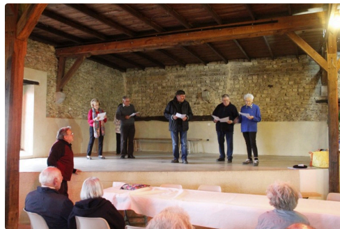
Patois des villages.