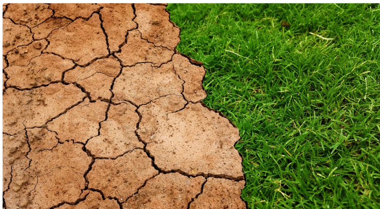
"Quel climat aurons-nous demain dans le Savès ?"

À l'occasion de la journée internationale de mobilisation pour le climat, l'association Savès Climat annonce sa création et invite pour l'occasion, à Samatan, à 19 h au cinéma, Aurélien Ribes, chercheur au CNRM-GAME (Météo France et CNRS).