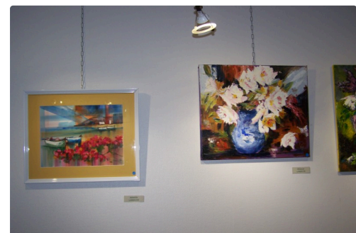
" Le bouquet" ( à l'huile) de Antonia Lorente