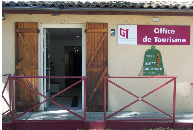
Les pinceaux en "goguette" des peintres de l'Atelier du Lac

À l'Office de Tourisme de la Gascogne Toulousaine