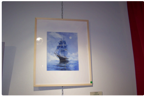
"Le trois mats" de Maité Lacombe