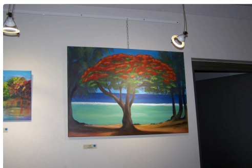
Un arbre d'inspiration exotique ( acrylique) "Le Flamboyant" d'Inès Fasan

Horaires et jours d'ouverture : lundi au samedi 9 h 30 - 12 h 30 et 14 h 30 - 17 h 30