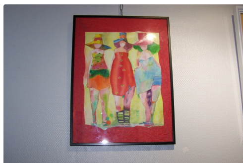
" Théâtre d'Été" d'Elisabeth Jeanneau