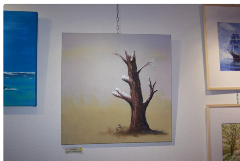
Un autre genre, plus dépouillé " Le vieil arbre sous la neige" (acrylique) de Martine Gava-Massias