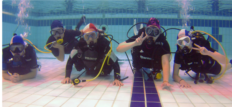
Des lycéens plongeurs grâce à Occit'Avenir

Comme chaque année depuis maintenant sept ans, les élèves de l'atelier scientifique et technique (AST) «Initiation à la biologie marine grâce à la plongée sous-marine» du lycée Alain-Fournier de Mirande ont validé en mer leur niveau 1 de plongée. Ils peuvent maintenant évoluer en mer avec un moniteur jusqu'à une profondeur de 20 mètres.