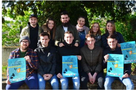
Festival de musiques actuelles

Une initiative originale où musique et gastronomie locale sont associées