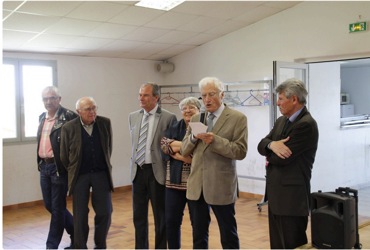
Le prix Dumont attribué.

La Société Archéologique et Historique du Gers a décerné, comme chaque année, le prix Dumont à un ouvrage dont le thème s'inscrit dans l'histoire, l'archéologie ou l'histoire de l'art dans le Gers. Pour 2019, le comité départemental de l'Association nationale des anciens combattants et amis de la Résistance, l'ANACR, a été récompensé pour son document Les femmes du Gers dans la Résistance .