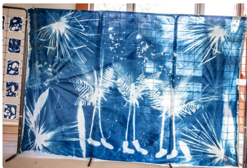
Le grand drap devenu cyanotype à la Palmeraie (exposé au Houga)