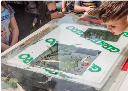
Bouquet varié recouvert d'une plaque de verre (d'où le reflet)...