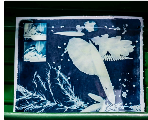
...et son cyanotype