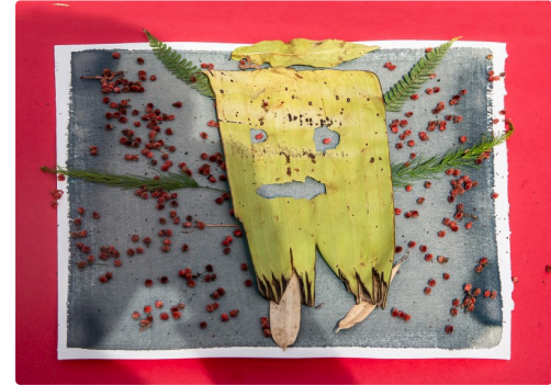
Préparation du fantôme à la Palmeraie