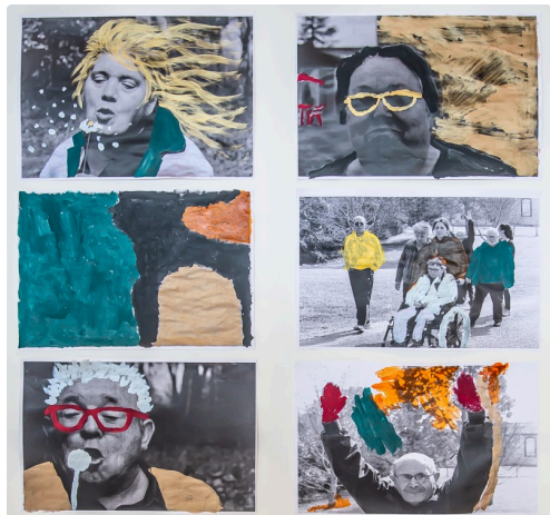
Dans l'exposition: photo et peinture