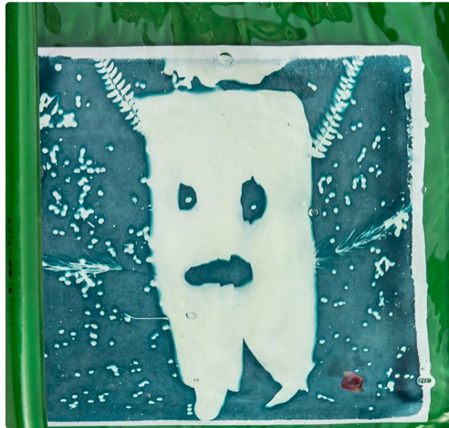
Le fantôme apparaît dans la cuvette