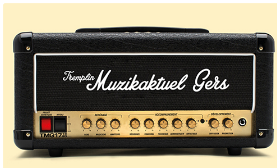
Deuxième soirée Tremplin Muzikaktuel Gers 2019

Vendredi 17 mai, à 21h, deuxième soirée du Tremplin Muzikaktuel Gers 2019 (gratuit) avec DSK Princess [rock fusion], From Dusk To Dawn [metal mélodique] et Supremacy [groove metal]