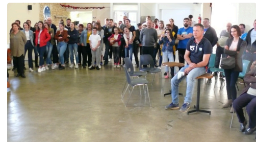
Les supporters étaient venus nombreux.