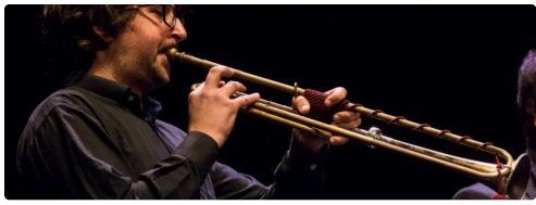
Pablo Valat - Photo Turba Consort