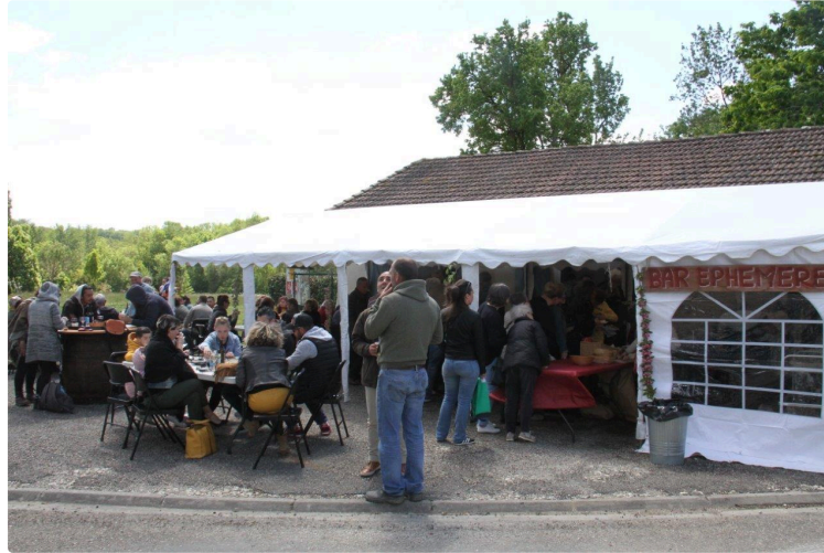
Un succès qui ne se dément pas

En attendant le prochain rendez-vous, lors de la fête du village