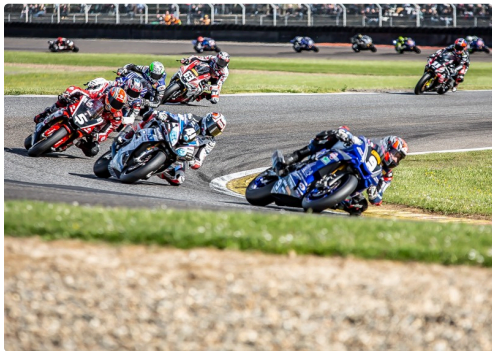
Superbike course 2 : Louis Bulle en tête