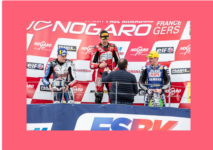
Superbes empoignades au Championnat Superbike à Nogaro

Samedi 4 mai, il n'y avait que deux courses pour la manche nogarolienne (la 2ème après Le Mans) du Championnat de France Superbike (le FSBK) Le reste de la journée était occupé par les essais. C'est tant mieux, car il y avait quelques gouttes de pluie l'après-midi, qui auraient pu inciter les teams à des choix de pneus ne convenant pas aux dix courses du dimanche 5 mai, qui a été une très belle journée ensoleillée, quoique il ait fait un vent froid. D'ailleurs, le public est venu en nombre le dimanche : il y a eu 12.478 spectateurs, soit 33 % de plus qu'en 2018.