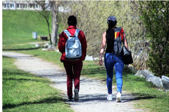
La randonnée annuelle du foyer culturel laïque.