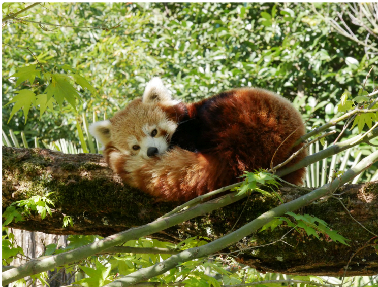
Le Parc animalier des Pyrénées célèbre ses 20 ans !