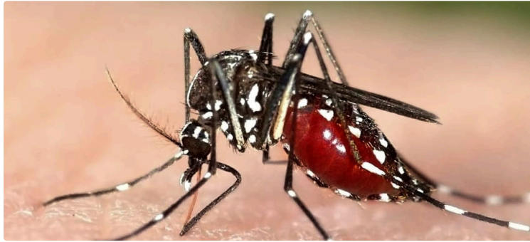
Le moustique tigre sous surveillance

Le moustique tigre est implanté et actif dans l'ensemble des départements de la région Occitanie. Chaque année, un dispositif de surveillance renforcée est mis en œuvre par les autorités sanitaires et leurs partenaires du 1er mai au 30 novembre. Pendant cette période d'activité des moustiques tigres en métropole, l'objectif est à la fois de limiter leur implantation et de prévenir le risque de transmission des virus dont ils peuvent être le vecteur (Chikungunya, dengue ou zika).