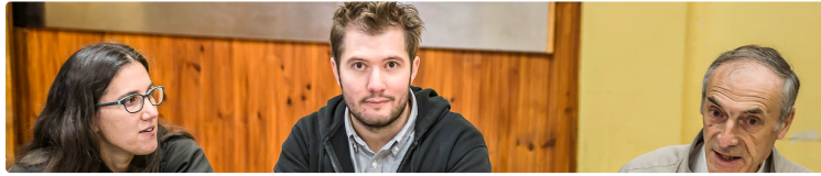
Le site Natura 2000 du Midou et du Ludon expliqué aux riverains

Sa gestion est sur la base du volontariat