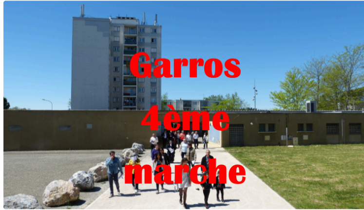
4ème marche du Garros