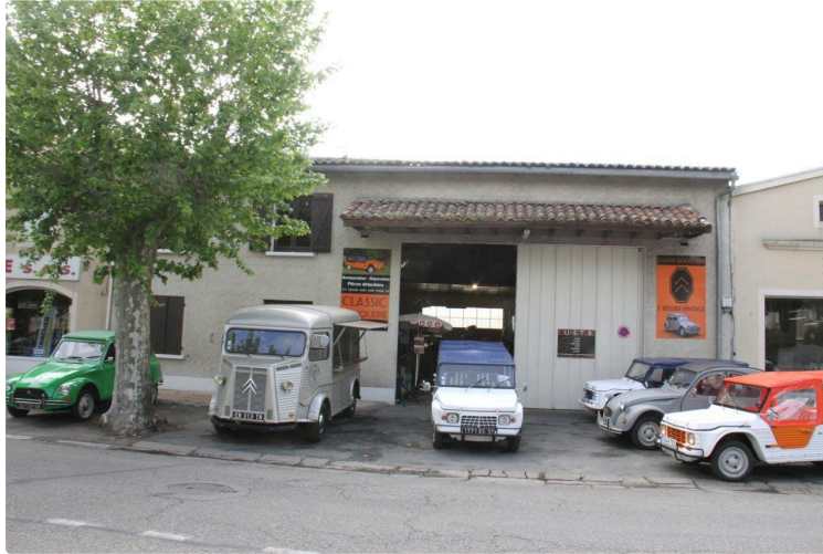
Du nouveau pour les véhicules anciens.

Samedi dernier 27 avril, l'équipage de la SAS Classic Bouquerie - L'Atelier Vintage, inaugurerait son magasin de vente de pièces détachées de 2CV et de ses dérivés (Méhari, Ami 6 et 8, Dyane, Acadiane...).