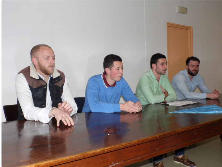
La "Peña l'Encierro" en assemblée générale

L'animation gratuite qu'elle propose connaît un grand succès populaire