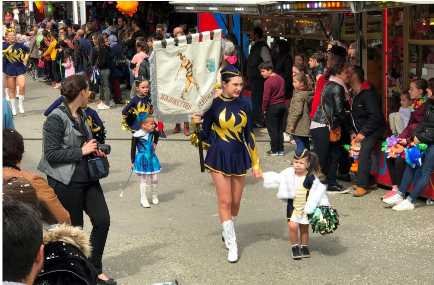
Les majorettes de Fleurance, très motivées