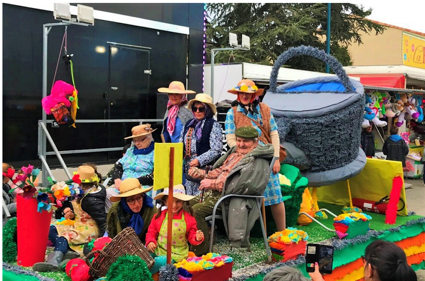
Les résidents de l'Ehpad ont également participé