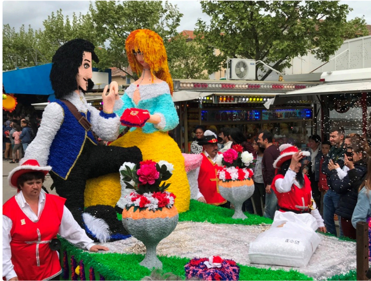
Retour en images sur le 30ème carnaval

Où pouvait-on croiser ce week-end une cigale et une fourmi, de belles Sévillanes, un bateau de pirates, les trois mousquetaires, un château fort, des majorettes, une reine entourée de ses dauphines ?... Au carnaval de Fleurance, qui fêtait cette année ses trente ans d'existence.