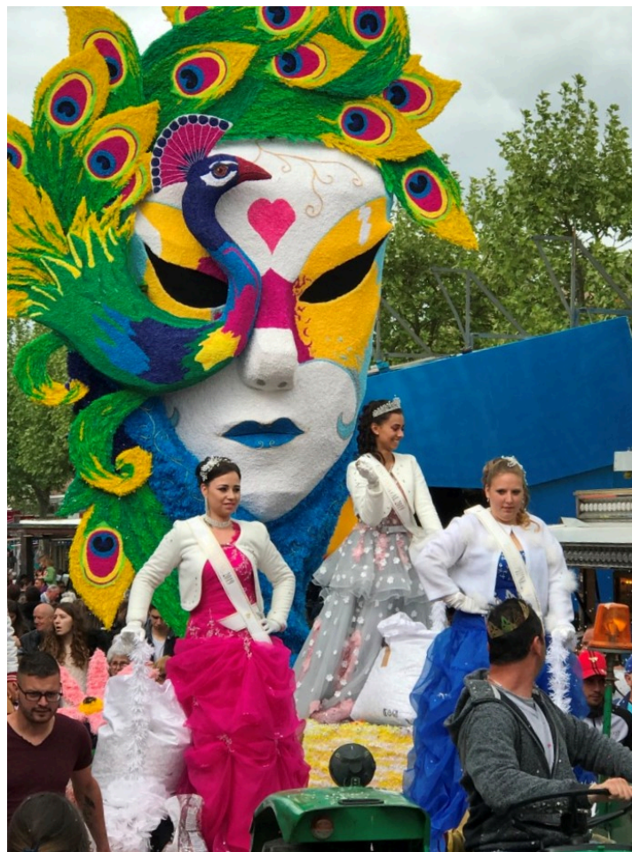
Et le joli sourire de la reine 2019