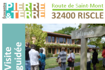
Assemblée générale & Ateliers sur la vie en montagne

Une après-midi entière à l'Écocentre Pierre & Terre