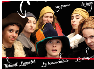
La Boîte à Jouer part en balade

En attendant le prochain festival, cet été