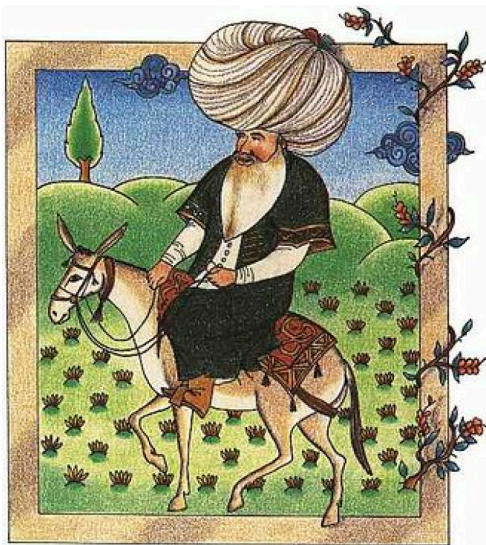
Nasr Eddin Hodja des contes pour les grands

Médiathèque du Colysée à Mirande Mercredi 21 octobre à 18 heures