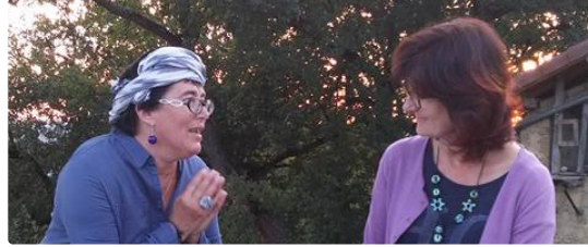
MIRANDE Conteuses de charme à la médiathèque

Nasr Eddin Hodja des contes pour les grands