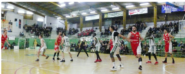
Basket-Ball :VCGB, la der en NM2, Auch en quart de finale de NM3