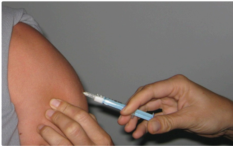
Vaccination : êtes-vous à jour ?

La Semaine européenne de la vaccination 2019 se déroule du 24 au 30 avril.