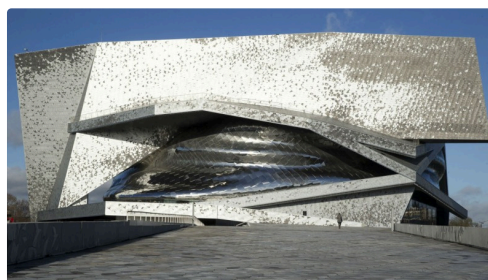
La Philharmonie de Paris