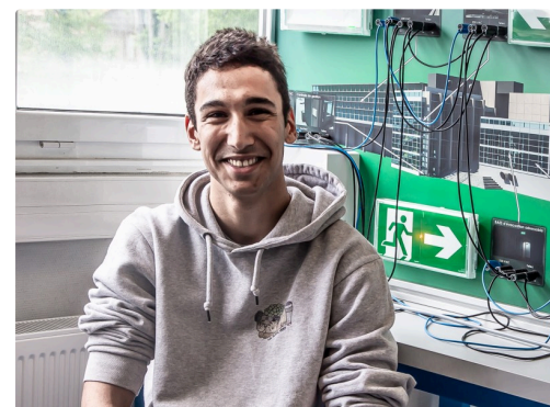
Un jeune homme d'abord avenant