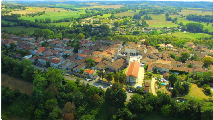
Conférence sur Jacques d'Armagnac, duc de Nemours