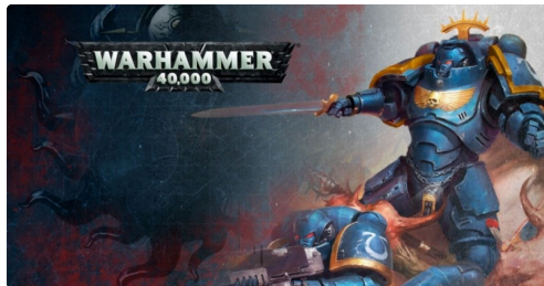
À la médiathèque municipale de Riscle, le mercredi 15 mai, de 14 heures 30 à 17 heures, un atelier Warhammer 40.000