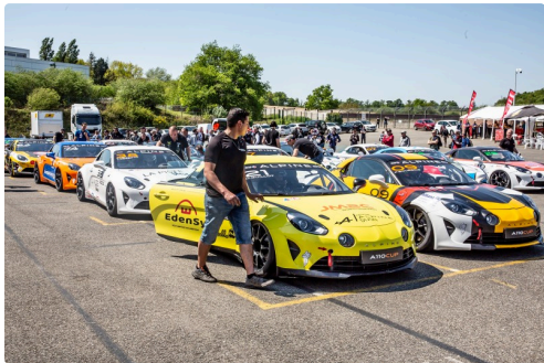
Les Alpine au départ des essais